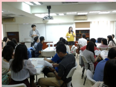
▲ 迦拿第一屆桌遊聯誼