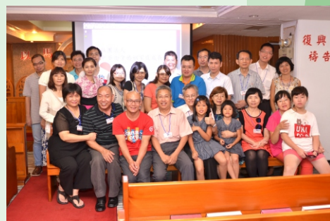
▲ 五年後第六屆會員大會