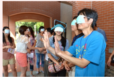
▲ 各種遊戲設計就是要激發創意