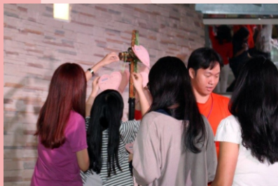
▲ 弟兄姐妹把擇偶條件掛在十架上