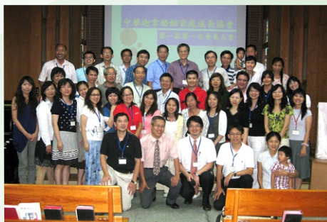
▲ 五年前第一屆會員大會

感謝神這五年多來，神透過帶領我們成立協會，讓我們經歷到弗三20的經文祝福“上帝能照著運行在我們心裏的大力，充充足足地成就一切，超過我們所求所想的”，也願弗三21“但願祂在教會中，並在基督耶穌裏，得著榮耀，直到世世代代，永永遠遠，阿們！”，就是“但願祂在教會中，也在迦拿協會中得著榮耀，直到世世代代，永永遠遠，阿們！”，願將一切的榮耀歸於神！