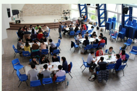
▲ 帶領他們往正確的婚姻之路邁進