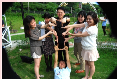
▲ 活動中展現平時人際關係的縮影