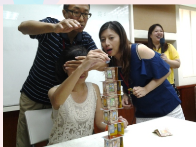
▲ 從遊戲觀察每一個人的反應