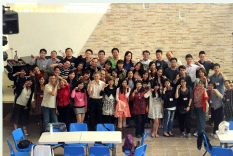
▲ 弟兄姊妹從北中南東來到迦拿