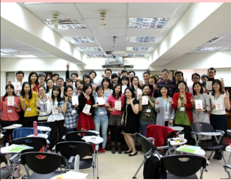
▲ 婚姻與家庭課程(每次上課約40人左右)