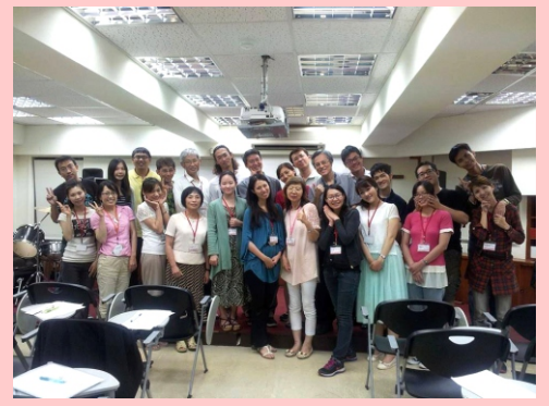
▲ 週四晚間婚前輔導(每期約有10對情侶)