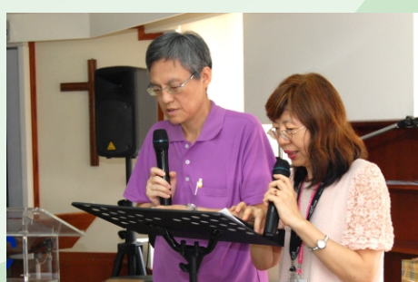
▲ 以正意分解神的道