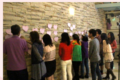
▲ 牧長與同工爲弟兄姐妹的心禱告